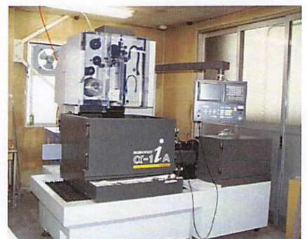
ワイヤー放電加工機