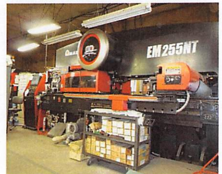
ターレットパンチングプレス